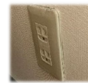
非常用コンセント